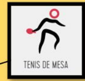
TENIS DE MESA