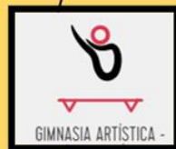
GIMNASIA ARTÍSTICA -